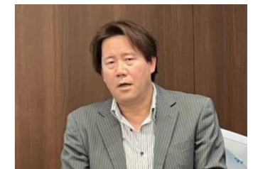
中部支部 飯沼支部長